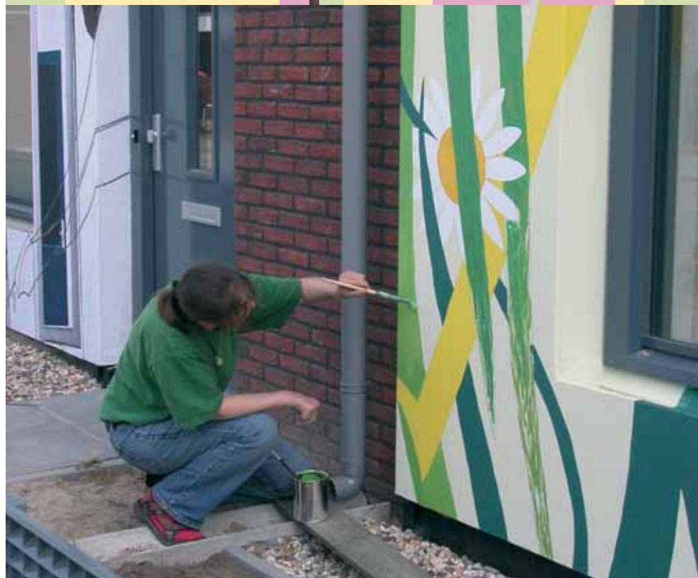
Kunstenaar aan het werk

De Waalsprong is goed vertegenwoordigd in de nieuwe Nijmeegse gemeenteraad. Vier interviews om de heren beter te leren kennen.